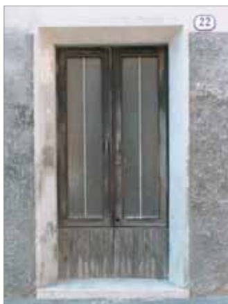
Via Fiume 22 Fronte Laterale