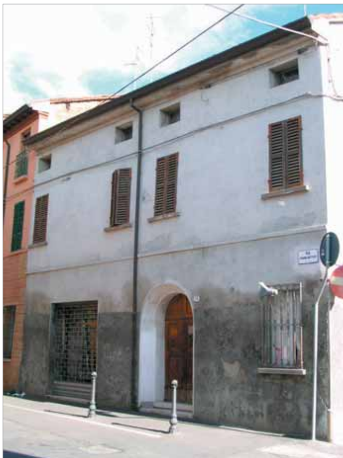
Via Battisti 15 Fronte Principale